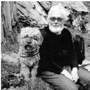
Jacques Blumer / Atelier 5 Dipl. Arch. ETH/SIA/BSA