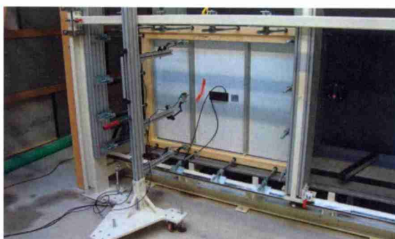
Sog- und Druck-Test eines Holz-PV-Fassadenelements an der BFH-AHB in Biel.

Von Laien und nicht informierten Bauverwaltern wird oft die Integra-